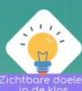
Zichtbare doelen in de klas