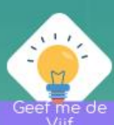
Geef me de Vijf