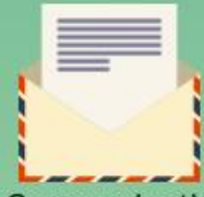
Communicatie intern en extern