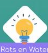
Rots en Water