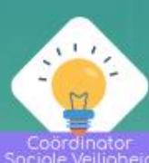
Coördinator Sociale Veiligheid